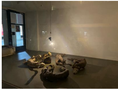
"vulnerable", Skulpturen, Atelieraufnahme, Ausstellungen Galerie DuflonRacz, Bern 2021 Local-Int, Biel 2025