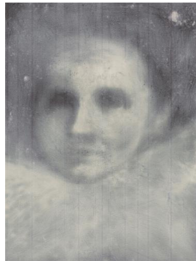
„vulnerable“, Pigmentdruck-Edition 6-teilig, 3/3, je A2, Galerie DuflonRacz, Bern, 2021