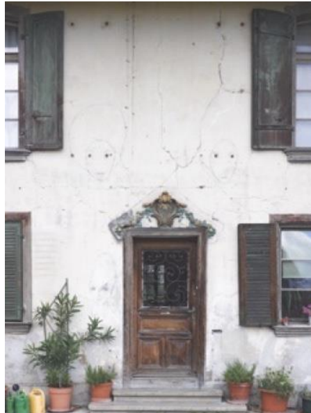
„Zeitzeichen, Bilder einer Fassade“, Kunst und Bau Brünnpark, 2011 (Dazu Film: Zeitzeichen – Bilder einer Fassade, youtube)