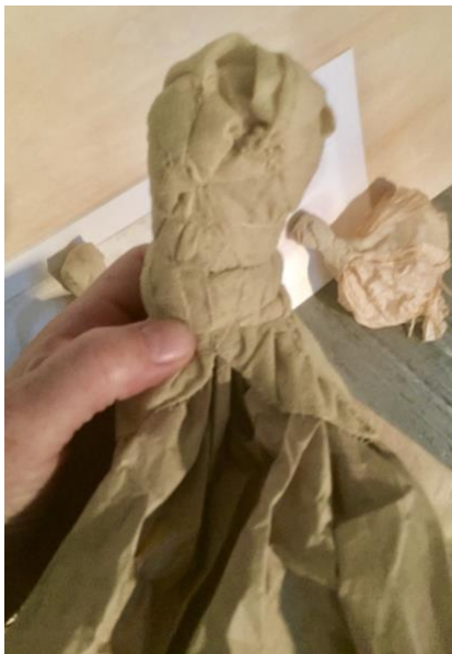
«Von Vögeln und Enten», Bern, 2018 (Ausschnitte)