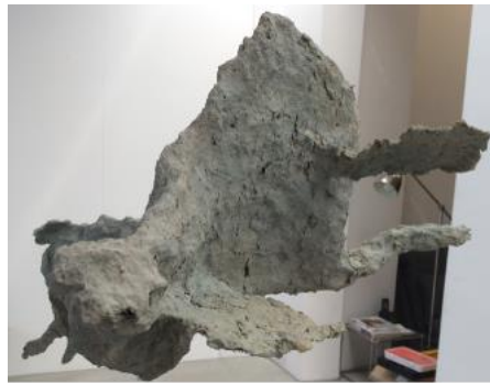
„Weder Fisch noch Vogel“, Installation hängend, 17-teilig, Cellulose, Holzleim, Drahtgitter, Ölfarbe, aus Ausstellung „blättern“, Kunstraum Oktogon, Bern, 2015