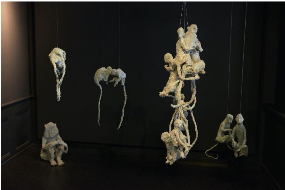
„Affengruppe“, (Ausschnitt) aus Ausstellung „le silence de l'autre“, Galerie DuflonRacz, Bern, 2017