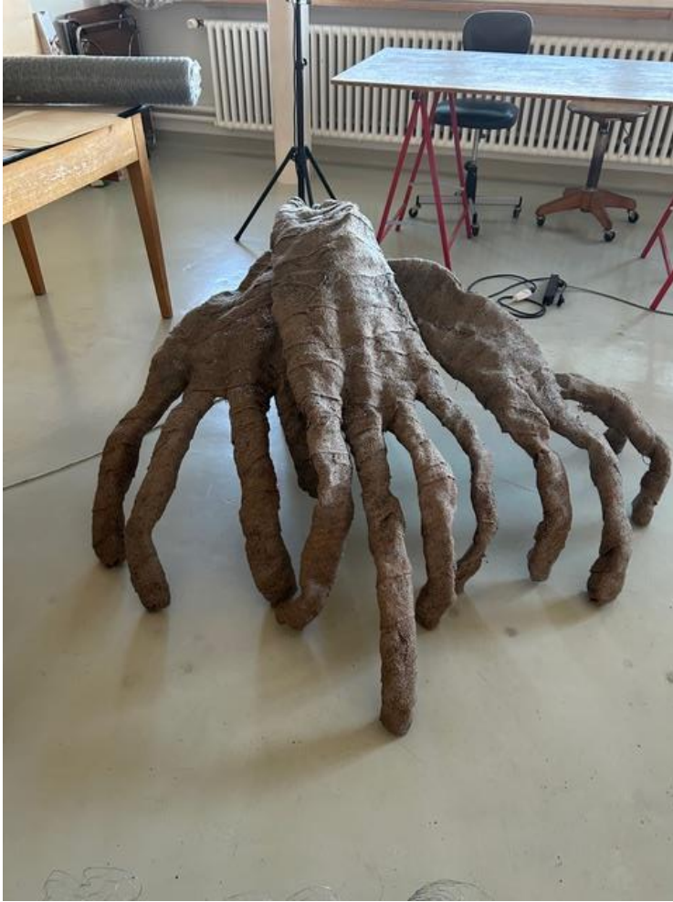
"Ohne Titel", 2025/ 2026